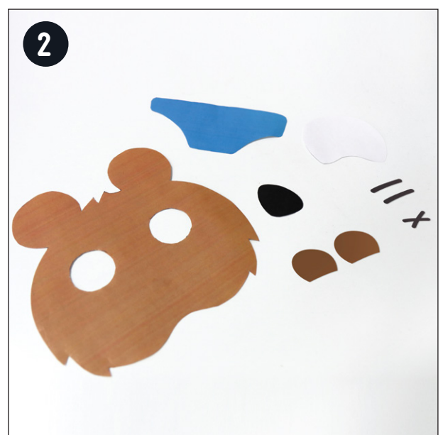
2 Découper les formes sur les feuilles que tu viens d'imprimer.