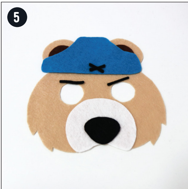
Coller les formes découpées les unes sur les autres en te référant à la photo des masques terminés.