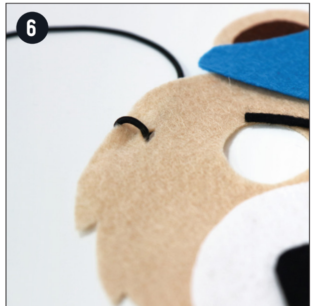
Faire deux petits trous sur les côtés de chacun des masques pour nouer l'élastique de part et d'autre du masque.