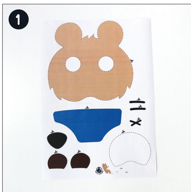
1 Imprimer, sur du papier classique, les gabarits (à retrouver à la fin du tutoriel).